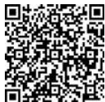
Фото- и видеорепортаж с выпускного вечера смотрите с помощью QR-кода.